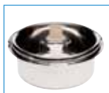
Cuve amovible Verwijderbare ijsemmer

* La turbine est équipée de 2 cuves (1 cuve fixe + 1 cuve amovible) et 2 pales (pale cuve fixe légèrement plus grande) pour vous permettre d'enchaîner une 2ème préparation. De turbine is voorzien van 2 ijsemmers (vaste ijsemmer + verwijderbare ijsemmer) en 2 schroefbladen (het schroefblad in de vaste ijsemmer is iets groter) waardoor u meteen door kunt gaan met een tweede bereiding.