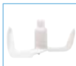
Pale amovible Schroefblad verwijderbare ijsemmer