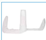
Pale cuve fixe Schroefblad vaste ijsemmer