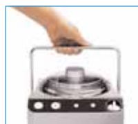
Poignée = transport Draaghandvat

* La turbine est équipée de 2 cuves (1 cuve fixe + 1 cuve amovible) et 2 pales (pale cuve fixe légèrement plus grande) pour vous permettre d'enchaîner une 2ème préparation. De turbine is voorzien van 2 ijsemmers (vaste ijsemmer + verwijderbare ijsemmer) en 2 schroefbladen (het schroefblad in de vaste ijsemmer is iets groter) waardoor u meteen door kunt gaan met een tweede bereiding.